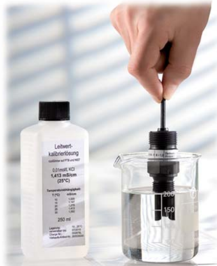
Messzelle in einer Kalibrierlösung

Bei der Kalibrierlösung ist die Abhängigkeit der Leitfähigkeit von der Temperatur zu beachten. Im Beispiel beträgt die Leitfähigkeit 1,413 \text{ mS/cm} bei 25^\circ\text{C} , auf welche die Lösung temperiert wurde.